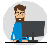
SUPPORT EN TI DE L'ENTREPRISE